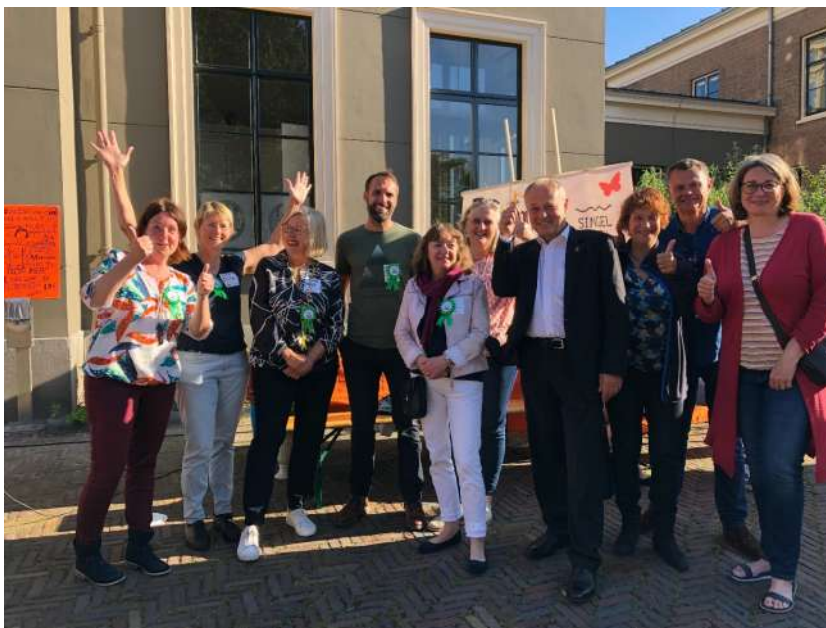
De burgemeester met oude en nieuwe bestuursleden, de organisatoren van de dag en de voorzitter van het Singelpark.